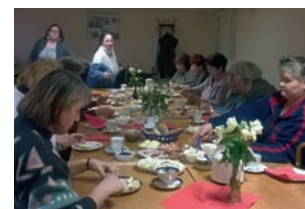
Die Themenfrühstücke (Foto) sind beliebt.

Ihr 25-jähriges Bestehen feiert jetzt die Gesellschaft für Arbeit und Soziales (GefAS), die unter anderem in Nord ak-tiv ist. Derzeit werden Interessierte für die Tafel (Hegelstraße 22) und die Möbel-kammer (Eisenbahnstraße 80) im Rah-men des Bundesfreiwilligendienstes ge-sucht. Interessenten sollten dort direkt nachfragen. Spenden, auch von Kleidung und Geschirr werden gern in der Kleider-kammer (Hegelstraße 22) angenommen, montags bis donnerstags von 10 bis 15 Uhr sowie freitags von 9 bis 14 Uhr.